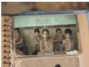
JA VY MY 2 IR/02' SK TITULKY