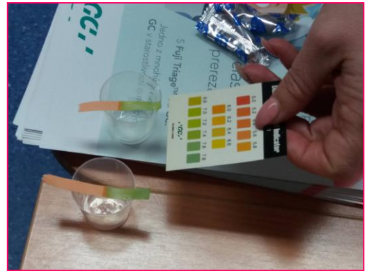
Zisťovanie pH sliny